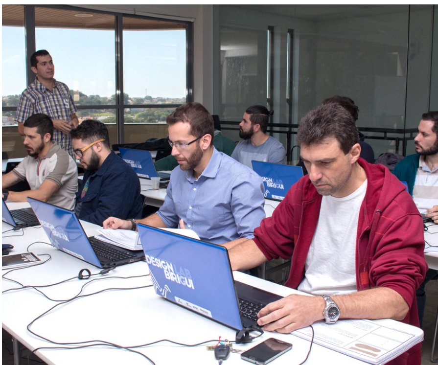
Participantes recebem orientações sobre Rhinoceros com atividade prática

Inclusive, a segunda turma do último curso citado, começou em agosto, com foco em solados, e terminará em dezembro. Nove profissionais fazem parte do grupo. ■