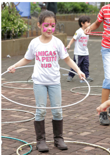
Não vai faltar diversão no Brinca Birigui

A lém das ações da Semana da Indústria, outubro também terá eventos para o público infantil. Para marcar a comemoração do Dia das Crianças, será realizado o esperado “Brinca Birigui”.