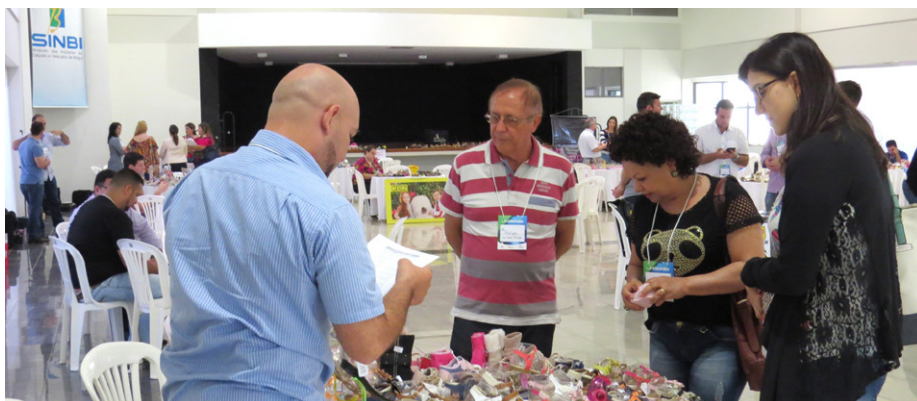
Empresários mostraram novidades da coleção primavera-verão

Puderam participar como expositores, empresas que fizeram parte do Projeto Comprador deste ano e que já garantiram participação para a próxima edição, que ocorrerá em 31 de janeiro e 1º de fevereiro de 2017.