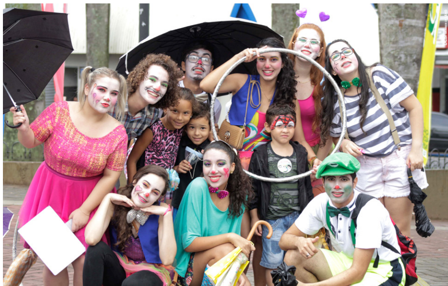
Apresentações teatrais e musicais reúnem as famílias no Brinca Birigui

As atrações gratuitas prometem reunir toda a família para momentos de muita diversão. As crianças poderão se divertir com as brincadeiras esportivas, jogos, apresentações culturais e teatrais, música e muito mais. Neste ano, o