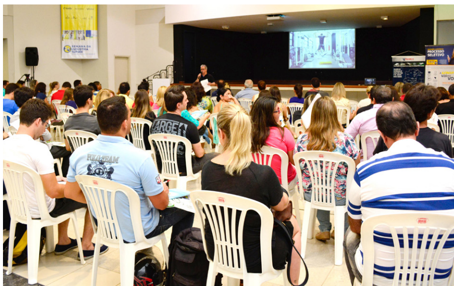
Participantes da Semana da Indústria, do ano passado, durante palestra