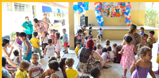
Mais de 3 mil crianças serão beneficiadas com a ação