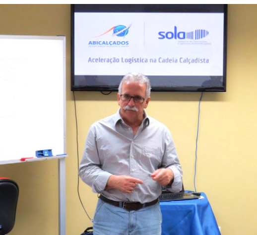
Diretor do Sinbi incentivou a participação