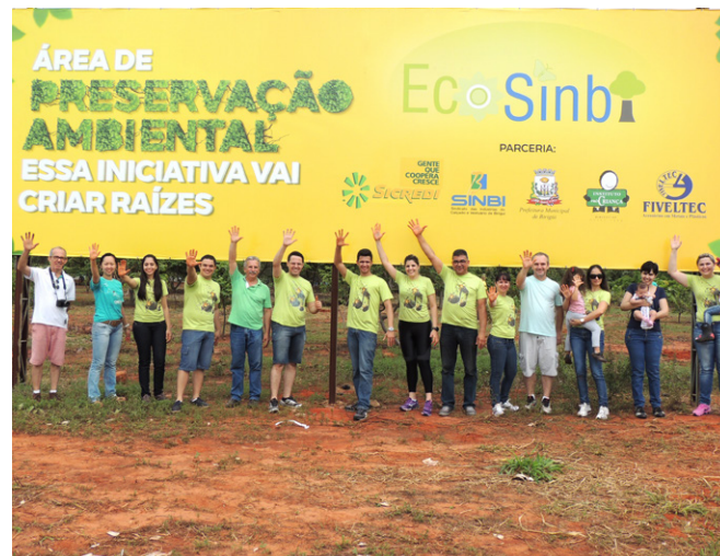
Área verde é mantida pelo Sinbi e seus parceiros