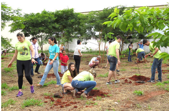
2015: 240 mudas de árvores nativas, frutíferas e ornamentais foram plantadas

Também haverá uma ação de cunho social, em parceria com o Instituto Pró-Criança, braço social do Sinbi. Antes de cada evento, os participantes poderão contribuir solidariamente levando brinquedos educativos/pedagógicos, que posteriormente serão doados para as crianças e famílias assistidas pela instituição. O instituto terá um espaço dentro do salão de eventos do Sinbi para receber as doações. ■