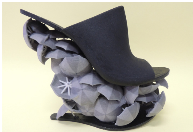
Produto impresso no Design Lab e que estará exposto no Inspiramais

O Fórum de Inspirações acontece nos dias 16 e 17 de janeiro, no Centro de Eventos Pro Magno. Trata-se de um ciclo que tem início com o estudo dos aspectos socioeconômicos e culturais globais e o comportamento de consumo no mundo, gerando assim referências e inspirações para a indústria da moda. A coordenação é do estilista Walter Rodrigues, com curadoria para