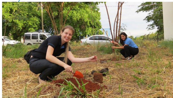
19 mudas de árvores foram plantadas na área verde

O Ecosinbi tem o objetivo de compartilhar informações e conhecimento sobre práticas sustentáveis, além de ações educativas. Ele conta com a parceria da Prefeitura de Birigui, das empresas Fiveltec, ITB Materiais Elétricos, Mejan, Sicredi, Noroeste Logística e Artemídia.