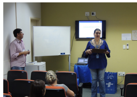
Além de fazerem bons negócios, visitantes puderam participar de palestras, ministradas pelo Sebrae-SP durante o evento