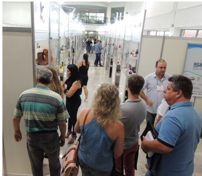
Evento deste ano atraiu mais compradores regionais