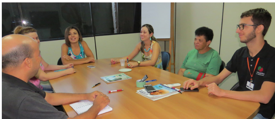
Com uma especialista os colaboradores se reúnem para a discussão de vários temas

Também recebem o Projeto Fora da Caixa as indústrias Klassipê, Klin, J Class, Sameka e Calmart. Qualquer empresa pode solicitar a implantação, que não tem custos. Basta entrar em contato com o Instituto Pró-Criança de Birigui pelo telefone 18 – 3649 8006.