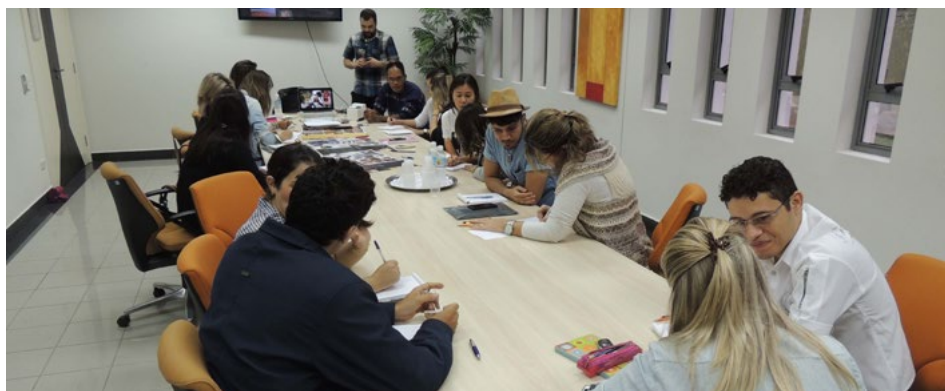
Na oficina de decodificação, estilistas aplicam conceitos na prática

objetivo propiciar novos conhecimentos e informações, que podem agregar valor ao produto, à marca e à empresa. Acreditamos que o empresário precisa enxergar seu negócio como um organismo vivo e buscar constantemente a inovação, que é essencial para se diferenciar num mercado competitivo.”