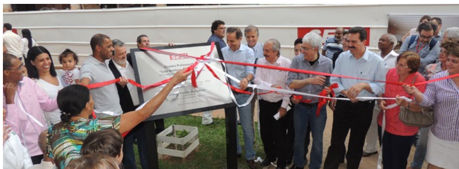
Quadra poliesportiva tem como patrono o ex-atleta Grão

Paulo Skaf disse que de nada adiantaria sua vontade ou da indústria paulista, se não fossem "a vontade e a determinação de guerreiros e guerreiras que fazem a educação no dia a dia", pedindo uma salva de palmas para os educadores.