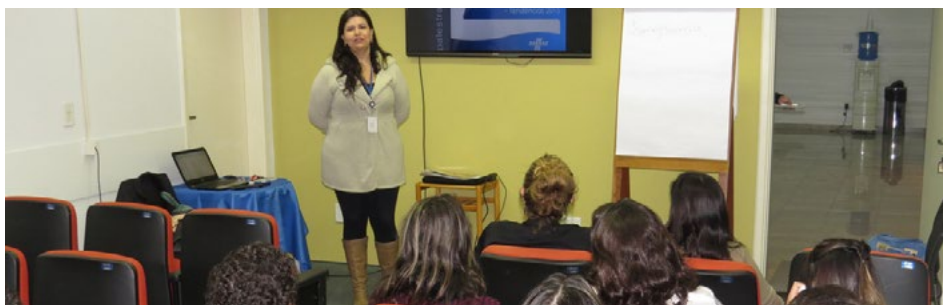
Missão internacional foi tema do último dia

O Senai possui experiência na busca por inovação em design para o segmento de calçados e artefatos a partir de viagens internacionais, trabalhando com as indústrias para que elas possam decodificar as informações adquiridas no dia a dia profissional.