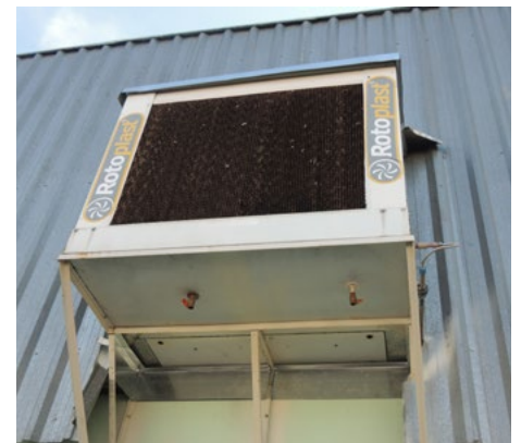
Reserva de climatizadores podem ser criadouros. Prevenção pode ser feita com pedras de cloro

Além disso, percebeu-se com o tempo que a reserva de água dos climatizadores vinha sendo um criadouro muito propício para o desenvolvimento do mosquito. "Quinzenalmente fazemos limpeza nos climatizadores, utilizando pedras de cloro, que possui ação mais eficaz se comparado à água sanitária", orienta César.