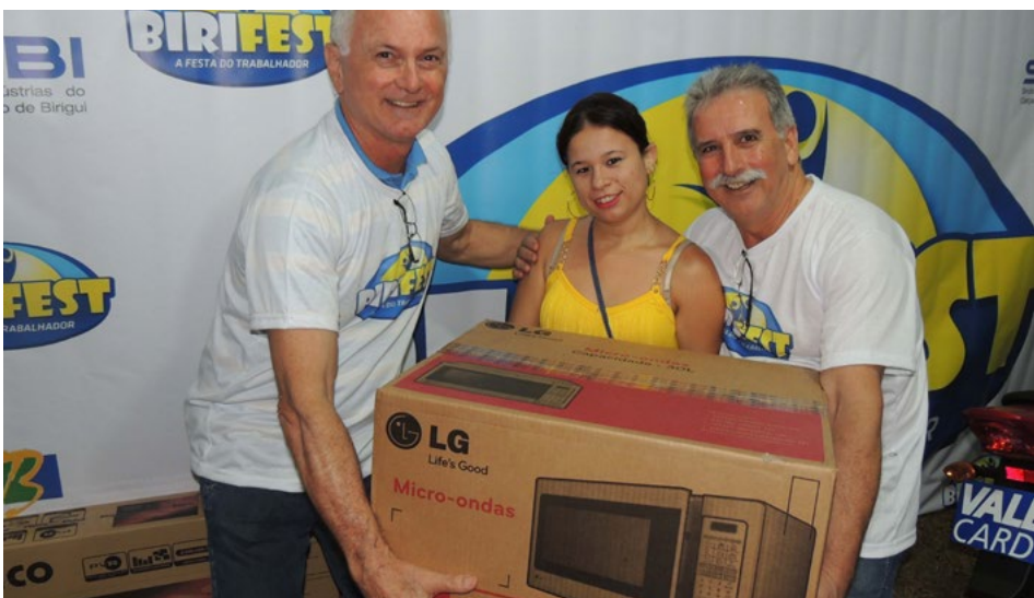
Muitos prêmios foram sorteados aos trabalhadores

A 7ª BiriFest foi patrocinada pelas empresas: Vale Card, Sicredi, UNA, Vimaplas, Beneficiamento Everest, Noroeste Logística, Orisol, Sintex, Termotextil, Linhasita, VRA, Eugeuni, Amazonas, Prisma/Chronos, Fiveltec e Klin. Apoio: SBT Interior.