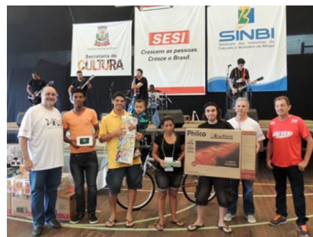
Dia do Trabalhador foi comemorado com muitos prêmios

Faça seu SEGURO com a gente, é mais FÁCIL!