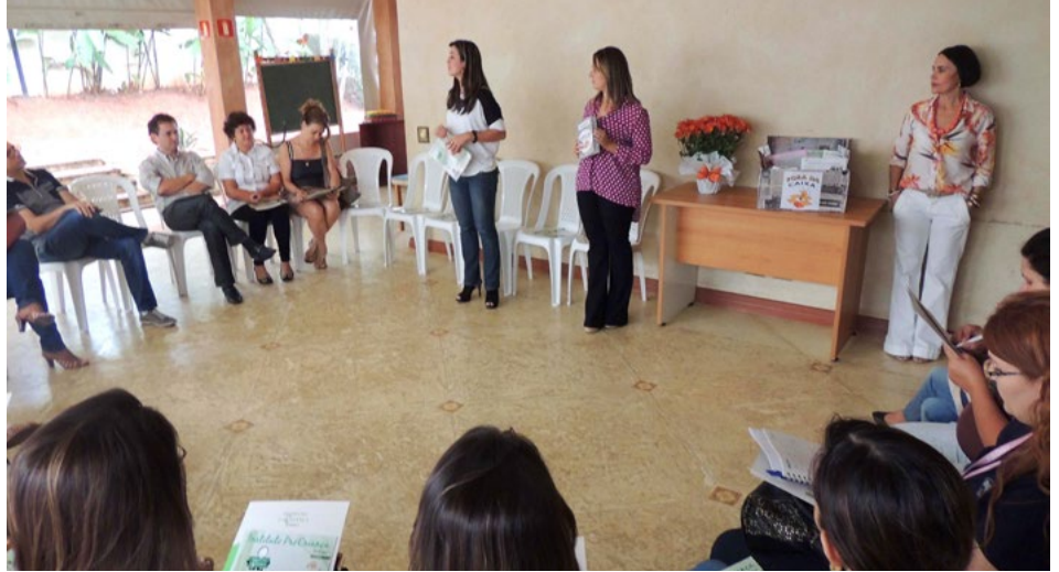
Líderes de RH participaram de café da manhã

O Instituto conta com uma revista trimestral da editora Pais Atentos, que apresenta temática socioeducativas. "Estes assuntos não podem ficar restritos a um grupo pequeno de pessoas. Precisam ser compartilhados. Saírem da caixa para que muitos possam ter acesso e