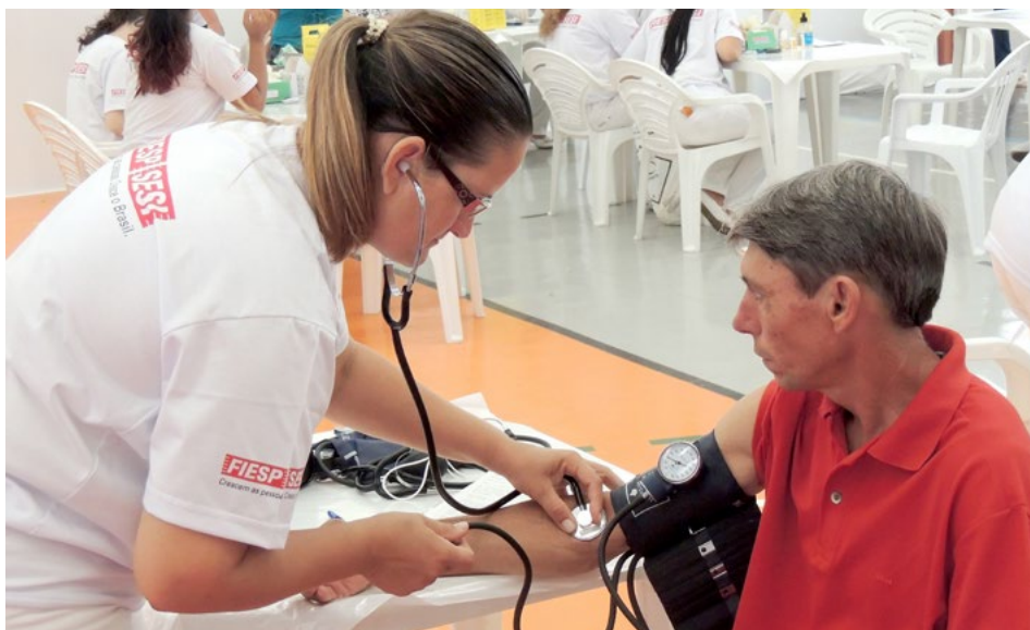
Ação Sesi Indústria ofereceu circuito saúde