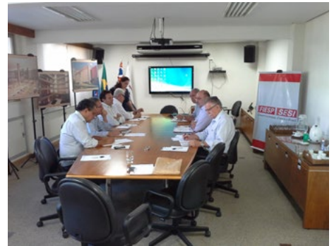
Grupo se reuniu na cidade de Franca