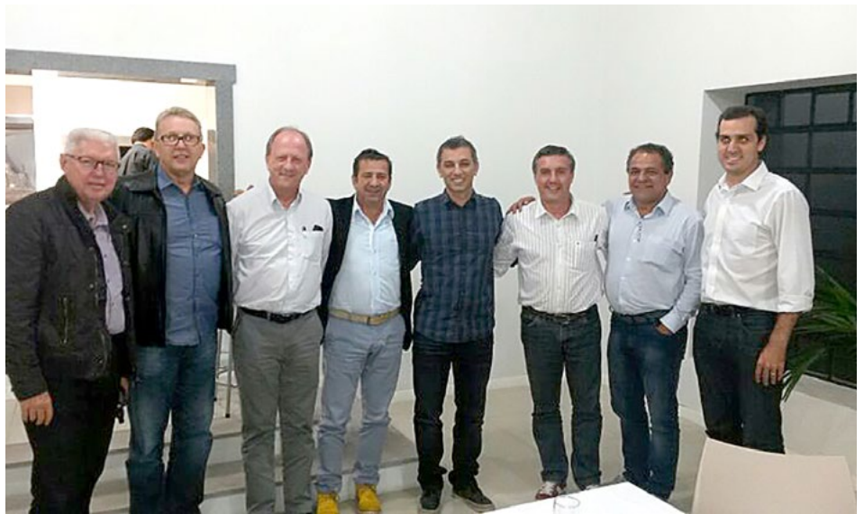
Lideranças se reuniram na sede da Abicalçados para discutir renovação da tarifa antidumping

mos tempos para o setor. Se conquistarmos a renovação do antidumping, teremos oportunidade de um fôlego de pelo menos cinco anos para adequar as empresas em melhorias de produtividade e, assim, estar mais preparados para a concorrência chinesa", afirma Gracia.