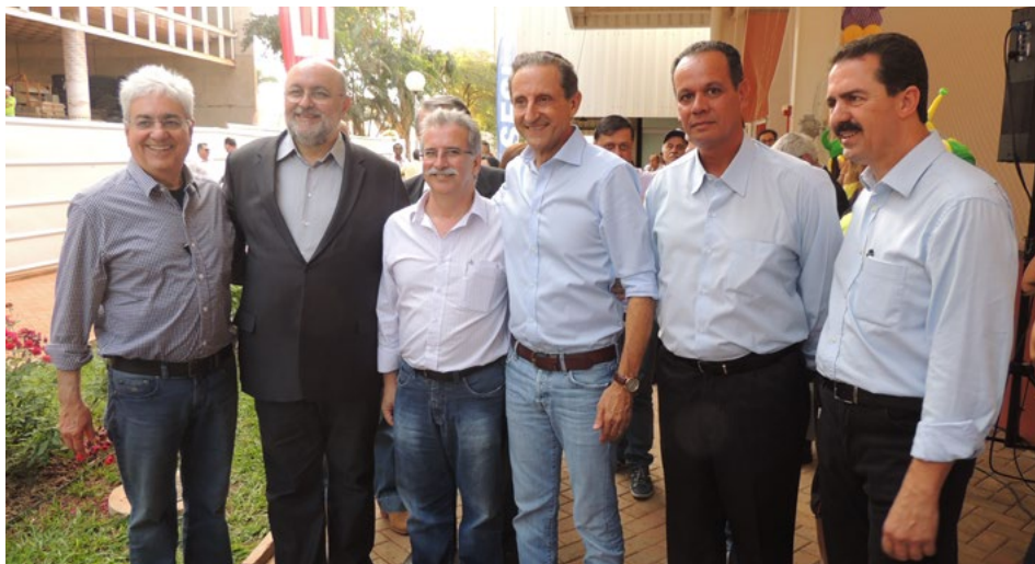
Autoridades prestigiaram solenidade