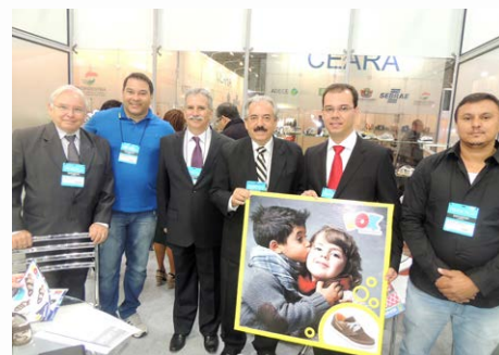
Empresa Dok Calçados participa pela primeira vez

polo, que não se restringe aos calçados infantis. 30 marcas expuseram peças de calçados que produzem. A iniciativa foi uma prévia para o 12º Projeto Comprador. Para os lojistas interessados foi entregue