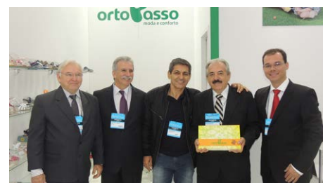
Ortopasso presente na feira