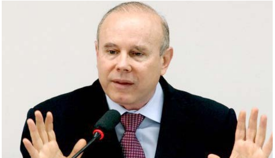
O Ministro da Fazenda, Guido Mantega, que flexibiliza a alíquota para exportações

Além da prorrogação do Reintegra, Mantega anunciou os novos limites para adesão ao programa de refinanciamento das dívidas das empresas com o Fisco, a margem de preferência de 25% para produto nacional em processos de licitação para manufaturados e a prorrogação do Programa de Sustentação do Investimento (PSI). Com informações do Jornal Exclusivo.