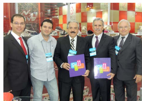
Autoridades visitam estandes

Além das expositoras, o estande coletivo contou com um showroom que apresentou a diversidade produtiva do