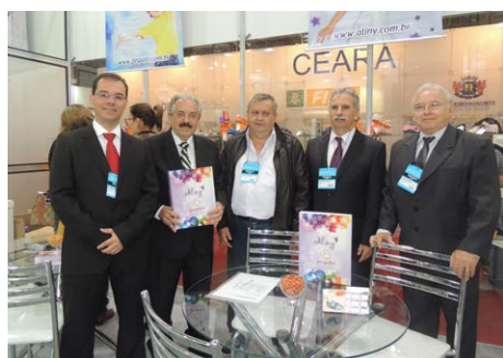
Estande contou com empresas dos segmentos infantil, masculino e feminino