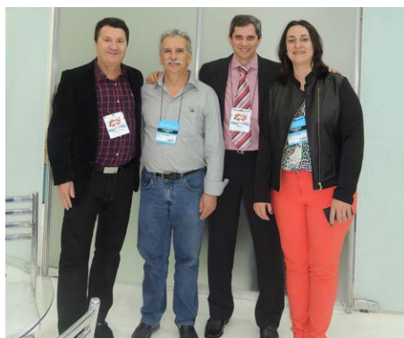
Pé com Pé marcou presença em estande individual