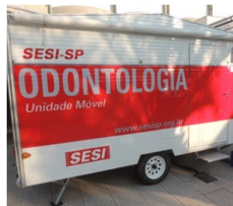
Trabalhadores têm apresentado demanda

está preenchida, com aproximadamente mil trabalhadores.