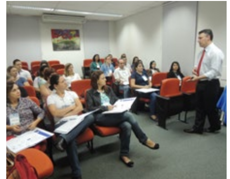
Representantes de diversas entidades participaram da reunião

No decorrer do curso foram explicados aos participantes, em sua maioria representantes dos departamentos de recursos humanos das empresas associadas ao Sinbi, os detalhes sobre preenchimento de informações que, a partir da implantação do eSocial, poderão ser consultadas via Internet pelos órgãos de fiscalização. "Entre as mudanças também está o registro do empregado, que deverá ser feito antes que ele comece a trabalhar – com a implantação do sistema não há mais possibilidade de fazer um registro retroativo", explicou entre os exemplos.