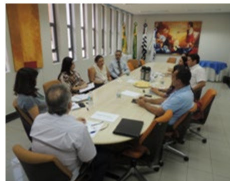
Representantes de diversas entidades participaram da reunião