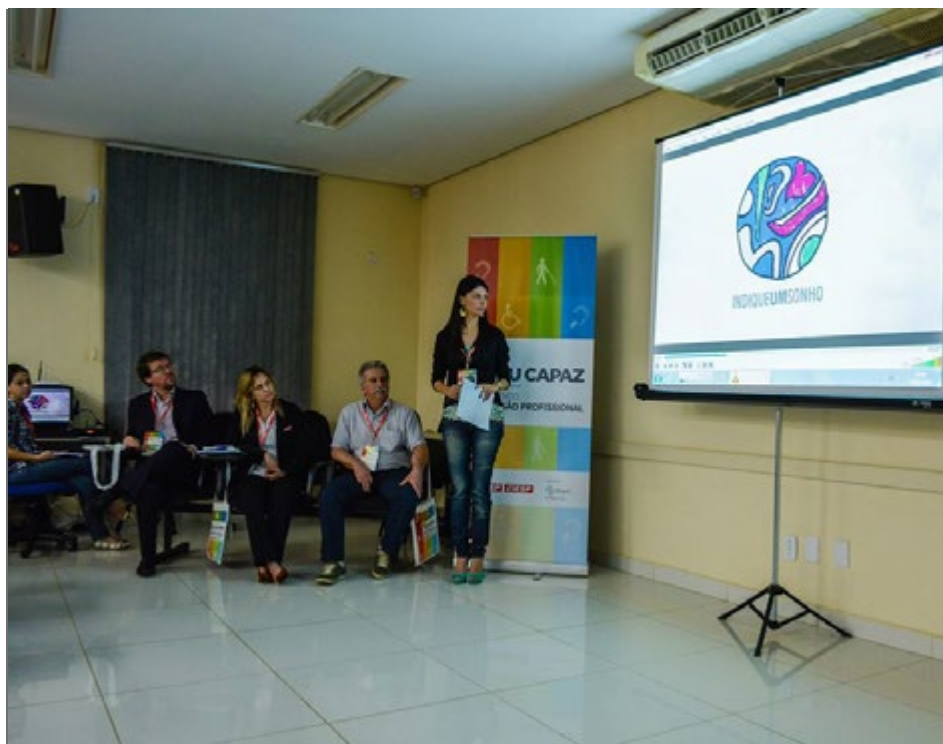
Sinbi apresentou projeto Indique um Sonho