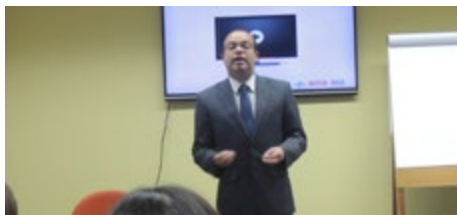
Curso reuniu representantes do departamento de RH de empresas associadas ao Sinbi

A Fiesp (Federação das Indústrias do Estado de São Paulo), por meio da CNI (Confederação Nacional das Indústrias), em parceria com a UniSinbi (Universidade Corporativa do Sinbi) e Sebrae, realizou na sede do Sinbi no dia 24 de setembro o curso "Como evitar problemas trabalhistas?", direcionado aos profissionais da área