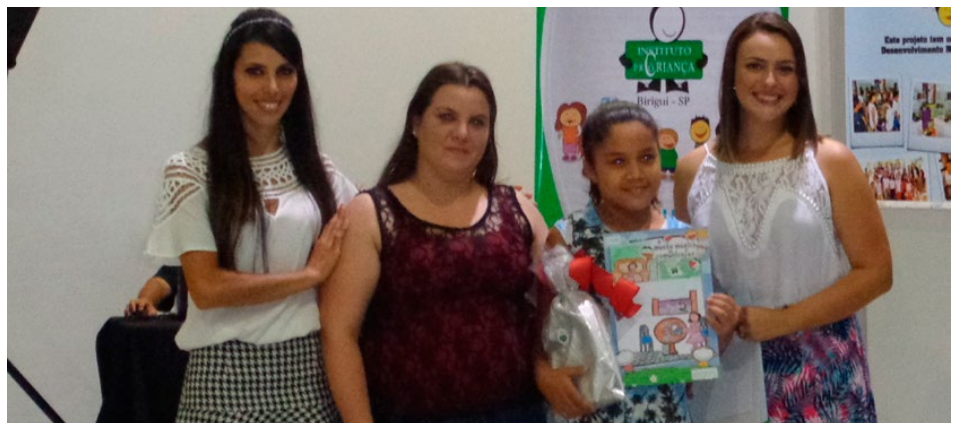
Alunos com trabalhos escolhidos foram premiados

Alunos receberam premiação por trabalhos desenvolvidos durante o projeto