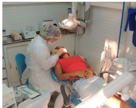
Foram 250 pessoas atendidas até o momento