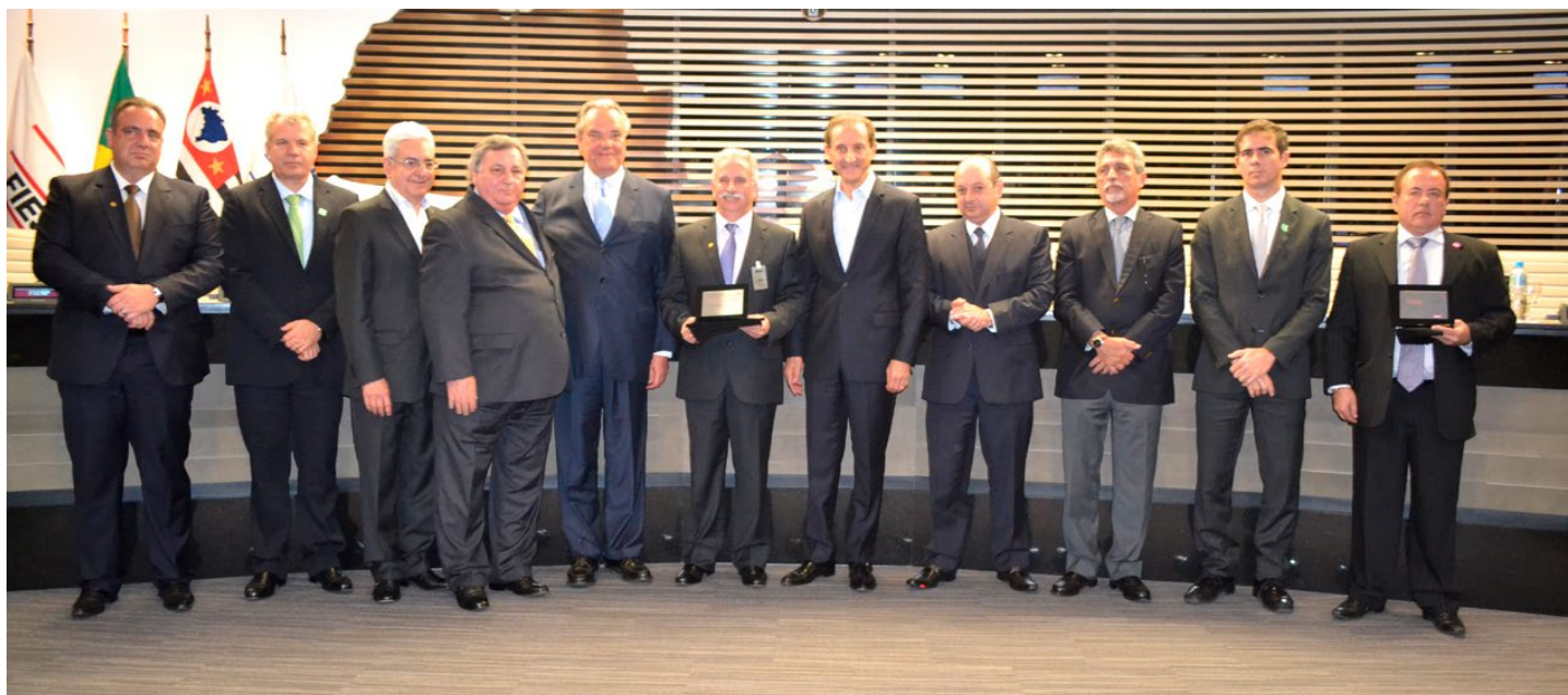
Sinbi foi premiado com a campanha Indique um Sonho