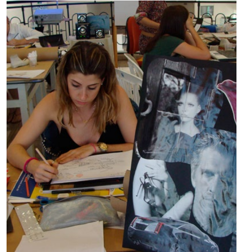
Objetivo é formar multiplicadores da metodologia

Para o repasse metodológico, o Sinbi contará com a contratação de um Instituto de design licitado pelo governo do Estado