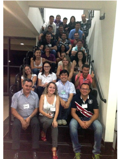
Curso foi oferecido às microempresas

Esse curso que faz parte do programa "Na Medida" é uma nova modalidade de ensino e aprendizagem oferecida pelo Sebrae. Ele tem como objetivo contribuir para que os empresários alavanquem os negócios, ajudando na superação de desafios e preparando o empreendedor para agarrar oportunidades e lidar com situações difíceis. São cursos, oficinas, palestras e consultorias planejados de acordo com as principais necessidades do empresário. E, ao participar, eles contam com consultorias específicas, apostilas e certificado de participação. Mas, além