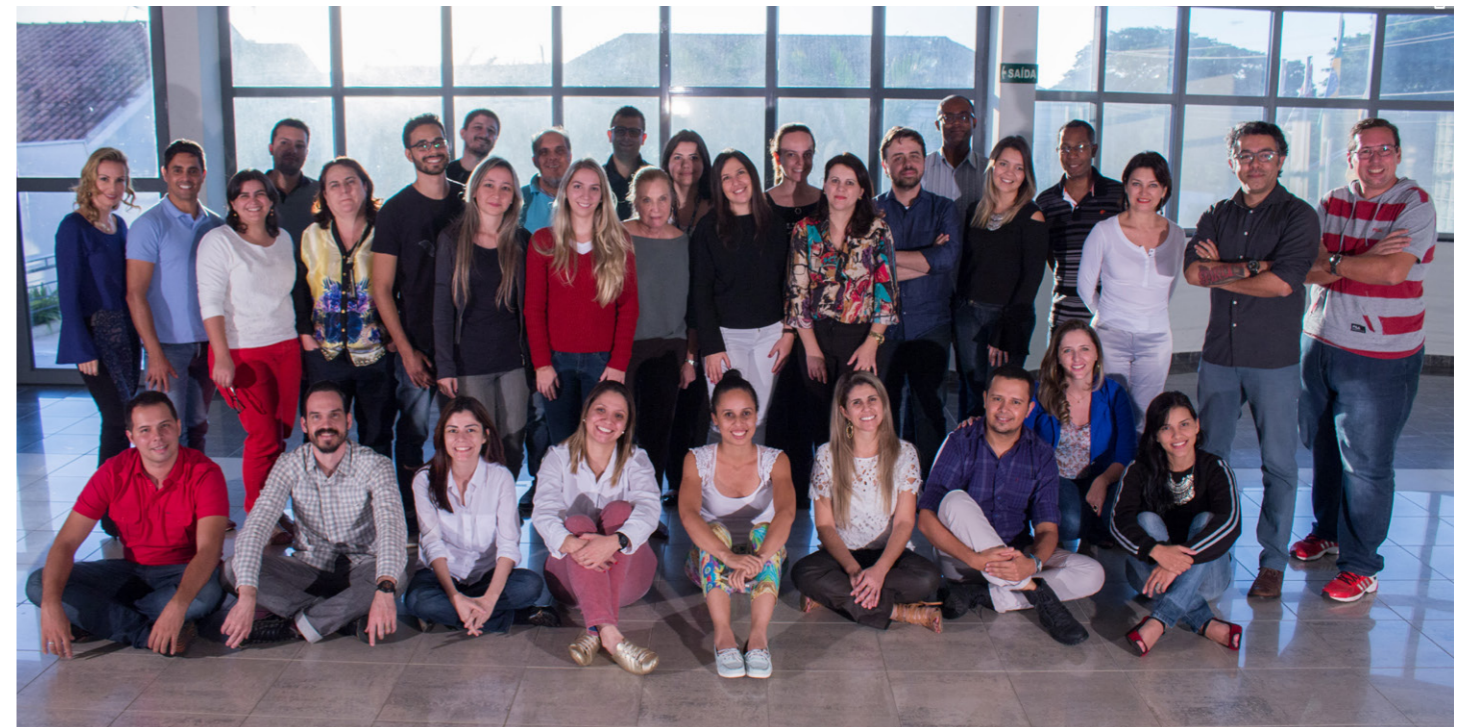
Participantes do processo de transferência metodológica em design estratégico. Eles atuarão como multiplicadores no polo

A transferência foi iniciada em março deste ano e os 32 participantes atuarão como multiplicadores no polo. O lançamento oficial do laboratório será no dia 3 de setembro, com a apresentação do seminário "O Design Estratégico como processo de qualificação de produtos e serviços na região". Nesse dia, os alunos mostrarão os resultados gerados na transferência, por meio de um projeto criado para o Instituto Pró-Criança.