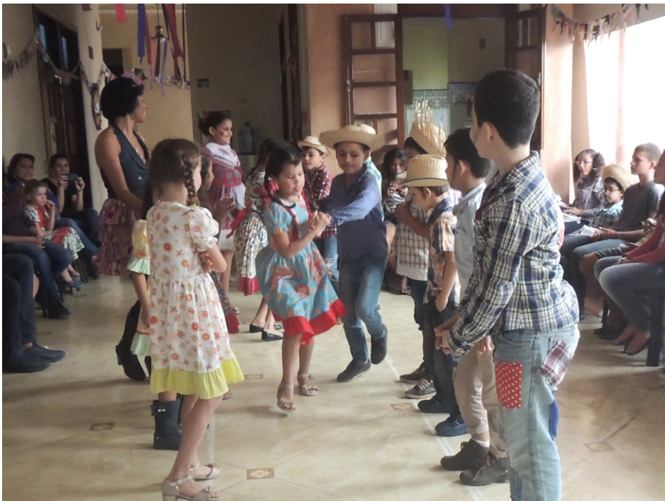
Alunos durante apresentação da quadrilha maluca

Junho é o mês das tradicionais festas juninas e o Instituto Pró-Criança, braço social do Sinbi, entrou no clima e organizou sua festa também. Muita música, guloseimas e alegria fizeram parte do arraial, realizado no dia 30 de junho. Durante todo o mês, os alunos foram envolvidos em atividades que valorizavam e orientavam sobre a cultura brasileira. Os próprios jovens e crianças fizeram a decoração e alguns pratos típicos servidos no dia. Teve várias apresentações de danças. Destaque para a "Quadrilha maluca" que mesclou canções tradicionais de São João com músicas populares do momento.