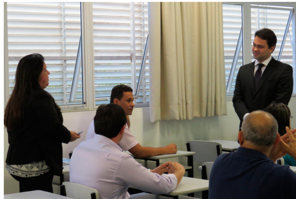
Consultor da CNI explicou sobre como atender a fiscalização

Os participantes também realizaram uma simulação para praticar a teoria. Interessados em saber quando haverá novos cursos e os temas propostos podem entrar em contato com o Sinbi. Telefone (18) 3649 8000.