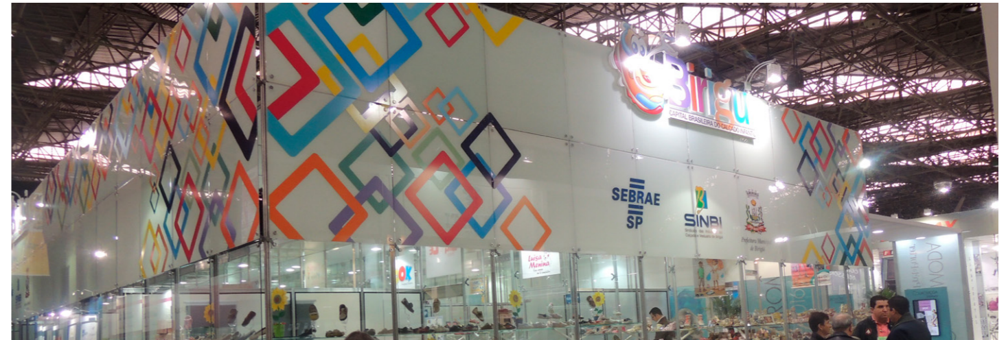
Neste ano, as vendas do estande coletivo chegaram a R$ 3,367 milhões contra R$ 2,921 milhões em 2014