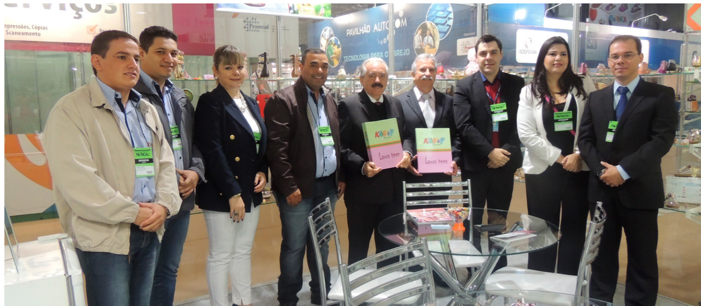
Estande coletivo foi subsidiado pelo Sinbi, Sebrae-SP e Prefeitura de Birigui