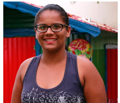
Natiele foi uma das escolhidas para representar os 45 municípios da região

A cada dois anos, a Associação de Promoção e Assistência Comunitária (Apac) realiza as conferências, que possuem nível municipal, regional e nacional. Trata-se de um momento onde crianças e adolescentes são ouvidos e podem discutir as necessidades e sugerir melhorias referentes a educação, saúde, segurança, social, entre outros.