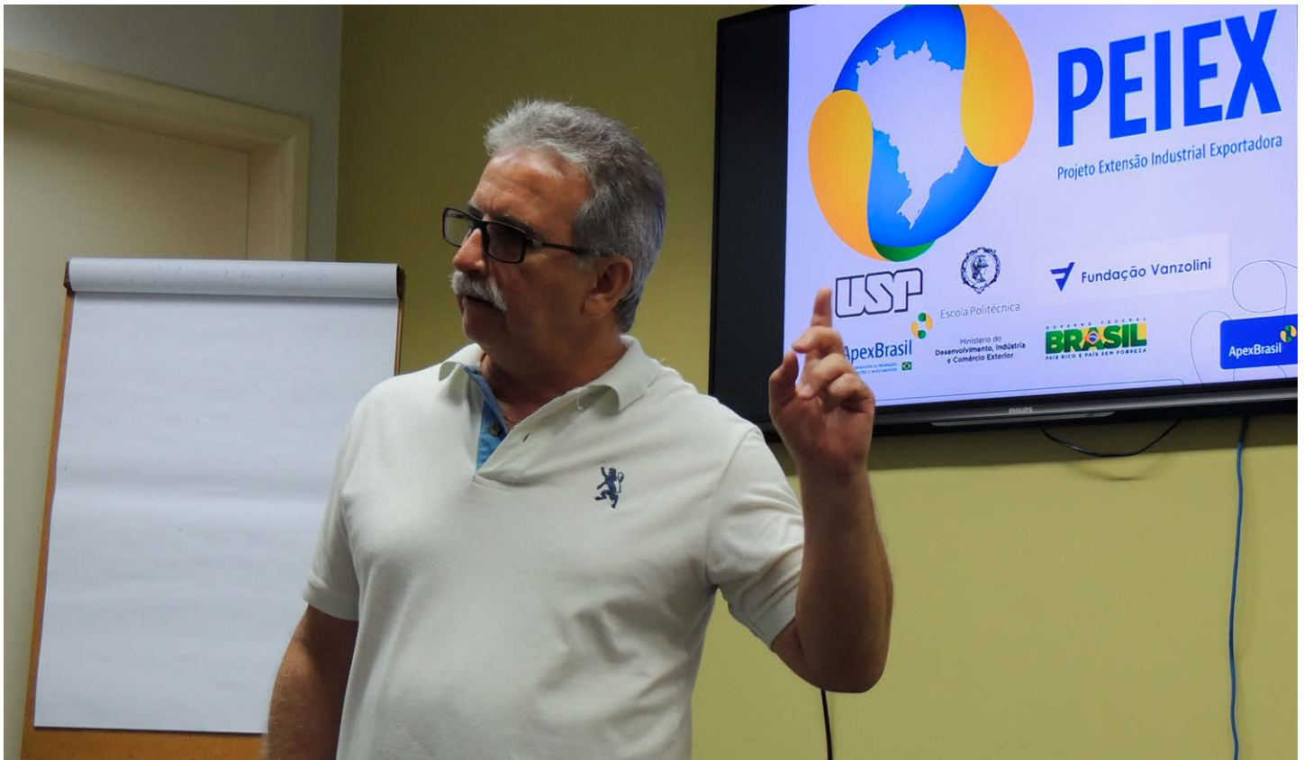
Presidente do Sinbi durante abertura. O setor busca uma recuperação, impulsionada pela valorização da moeda americana

Empresários poderão receber consultorias gratuitas e preparar suas empresas para vender no comércio externo