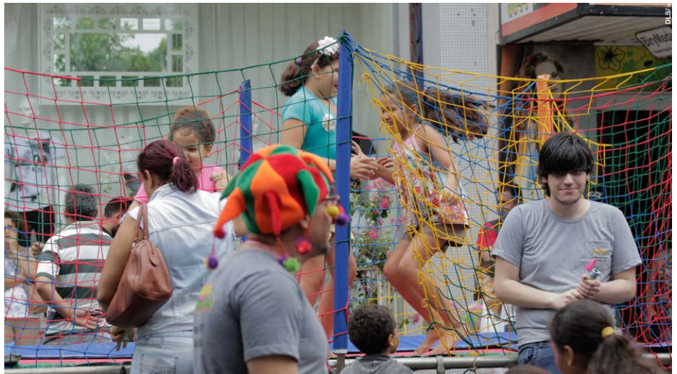
Nem o tempo chuvoso desanimou os pequenos

A festa também teve tendas de pipoca e algodão-doce de graça, pula-pula, show de mágica, apresentações musicais, teatrais e circenses. Além