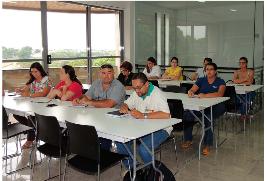
12 empresas estão envolvidas com o desenvolvimento do projeto