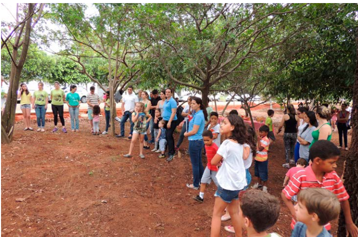
Reflorestamento foi realizado na área verde que fica no Distrito Industrial 1, em Birigui

“Podemos ter tudo de mais moderno, mas sem o meio ambiente somos incompletos. E quando você se envolve com um projeto como esse, se tornando multiplicador para a comunidade, essas ações vão se ampliando e mais pessoas se beneficiando.”