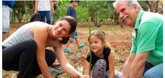
Em 2016, todos os eventos do Sinbi serão carbono zero