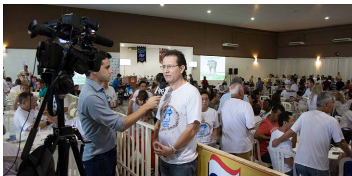
Presidente do Pró-Criança durante entrevista para a TV Araçatuba

A 9ª edição do Leilão da Solidariedade aconteceu no dia 21 de fevereiro, na Associação Cultural e Esportiva de Araçatuba (Acea). O evento, realizado pela Central Leilões, Loja Maçônica 193 e Lions Clube de Araçatuba, contou com diversas empresas apoiadoras e foi transmitido ao vivo pelo Agrocanal.