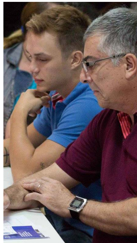
Multiplicação de Planos Específicos com os alunos da Fateb