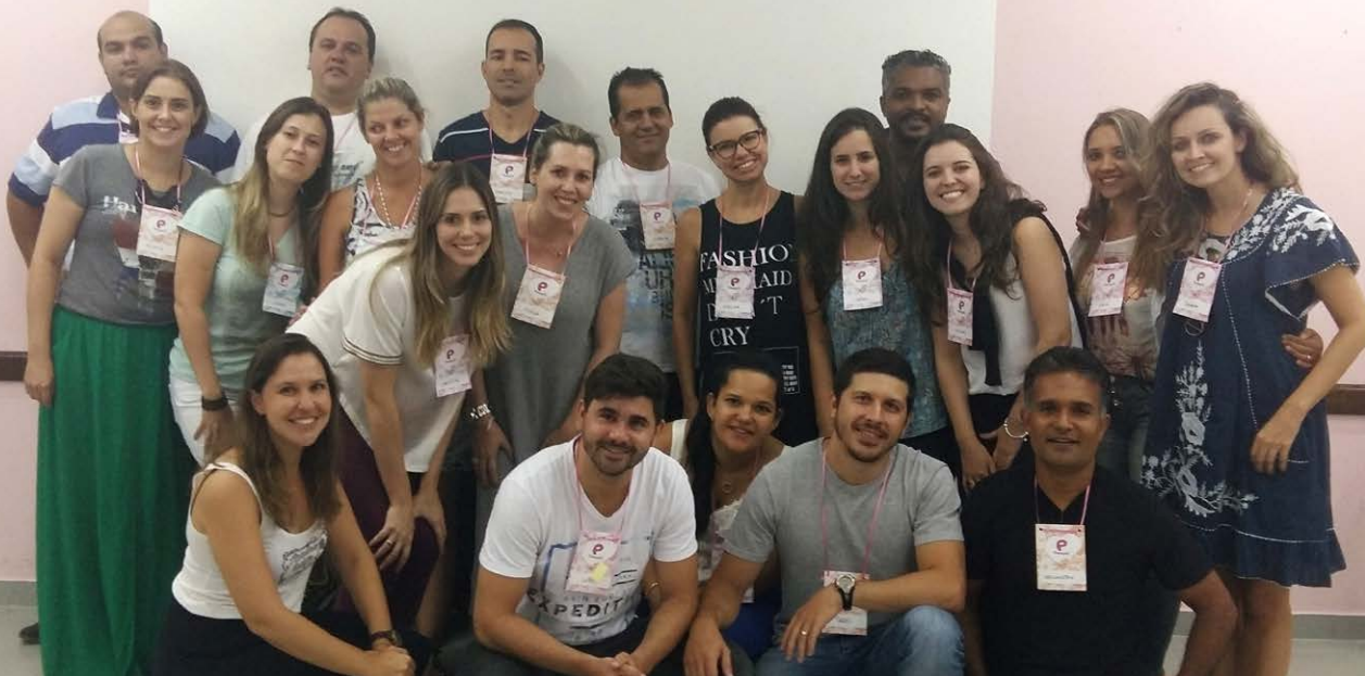
Multiplicação de Planos específicos na Empresa Pampili

Desenvolver a capacidade de repensar processos, criar estratégias competitivas e ampliar as possibilidades de inovação são alguns dos resultados proporcionados pelo conhecimento em design estratégico.