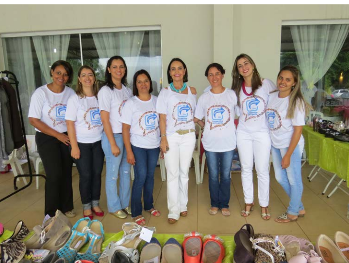
Equipe do Instituto Pró-Criança