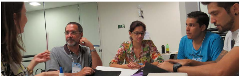
4º Workshop de Transferência Metodológica em Design Estratégico