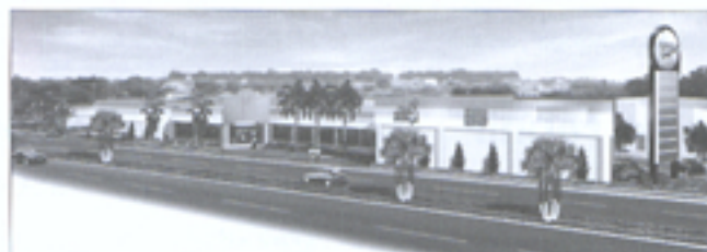
Estudo de fachada para o Birigüi Shopping do Calçado

Marco Antonio Oliveira, participou da 27ª edição da Fimec representando a entidade. A Fimec 2003 foi realizada de 24 a 27 de abril em Novo Hamburgo/RS. O evento foi concorrido. Contou com mais de 1.200 expositores espalhados numa área de 35 mil metros quadrados, mostrando o que há de mais atual em termos de couros, sintéticos, materiais alternativos, máquinas, equipamentos, solados, saltos, adesivos e produtos para acabamento, entre outros utilizados na fabricação de calçados. O clima este ano foi de otimismo. Estiveram presentes representantes de 15 estados brasileiros (o Rio Grande do Sul com 626 empresas e São Paulo com 156) e de 18 países (86% Brasil, 9% Itália e 5% para os demais). Entre os expositores, 1.030 eram indústrias do setor coureiro-calçadista e 210 de serviços, entidades, imprensa, tecnologia e informática.