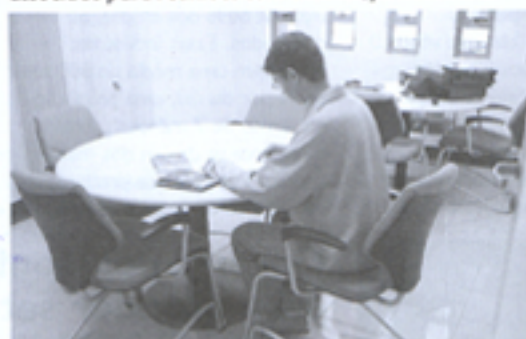
A biblioteca possui livros e revistas especializadas sobre o setor calçadista