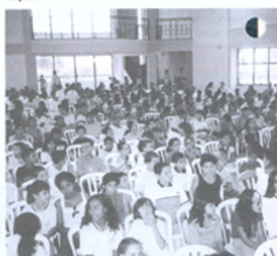
O Sindicato também tem salão de eventos para benefício dos associados