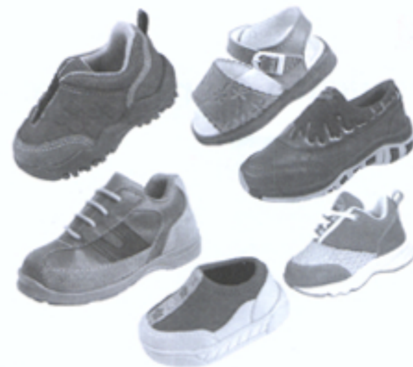
Calçados infantis de Birigüi serão alvo de projeto de divulgação

O papel do Sebrae é de moderador. Os grupos trabalham com consenso e não unanimidade. O trabalho só se desenvolve se houver participação", afirmou.