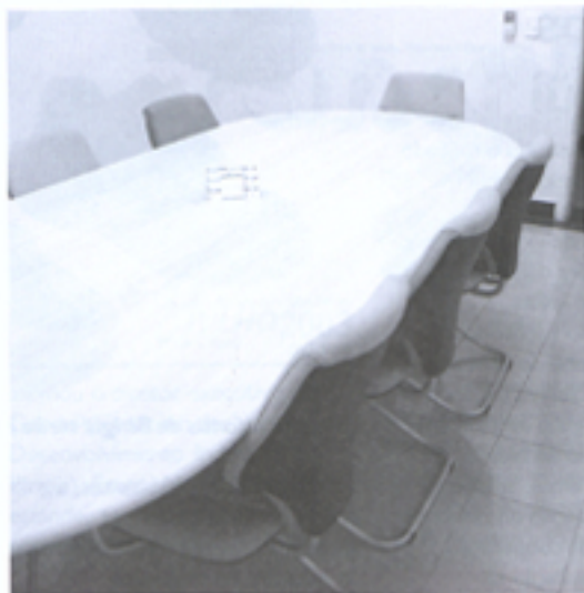
A sala de atendimento pode ser utilizada pelo associado para reuniões com clientes/fornecedores

Para se ter uma idéia da importância da militância política do Sindicato nas mais diversas esferas, pode-se destacar a ação para liberar o prédio anexo ao Centro Avak Bedouian para a instalação de uma Escola Senai completa em Birigüi; o apoio conseguido junto à Fiesp para tornar a cooperativa de crédito do Sindicato a primeira a ser objeto de estudo, visando receber recursos de fundos inclusive internacionais para financiamento; e a instalação de uma escola técnica (Fatec) conseguida junto ao governo do estado.