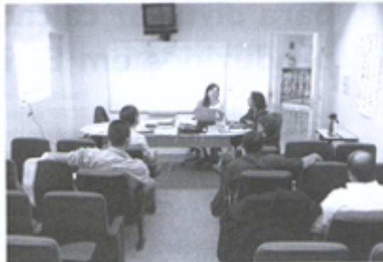
Empresas filiadas podem realizar treinamentos de funcionários no Sindicato