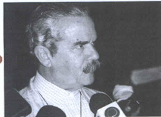
O secretário Meirelles: escola vai ser exclusiva do setor calçadista

Cada nova escola atenderá três municípios. A de Birigüi deverá suprir apenas as necessidades do setor calçadista da cidade, que carece principalmente de pespontadeiras.