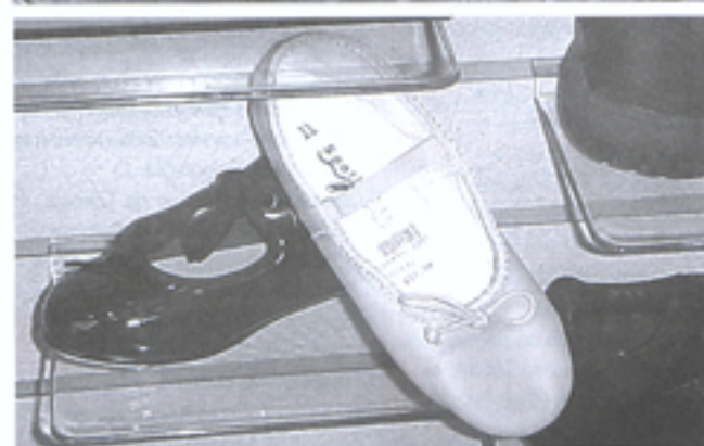
Em alta: elementos decorativos, sapatinhos boneca e com salto baixo

Tavares. Os acessórios vão seguir as mesmas tendências. No final do 24º Painel de Moda foi